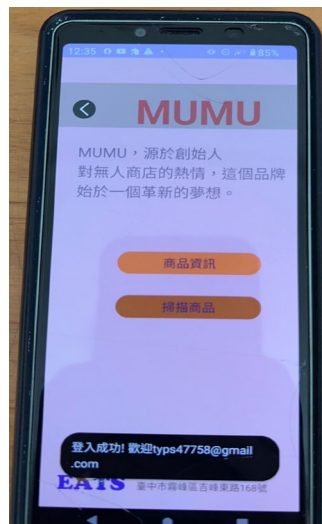
圖(二)登入成功介面