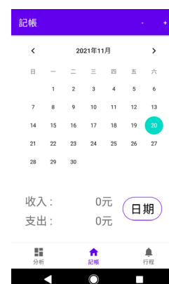
圖 1.APP 畫面

本專題使用 Android studio 開發出一個記帳記事管理程式，流程圖如圖 3.，使用者能透過這個 APP 來記錄平時自己消費跟收入的點點滴滴，並且透過 Excel 的樞紐分析法能夠呈現出使用者平常的消費動向及收入動向，方便讓使用者更容易對自己的財務做管理