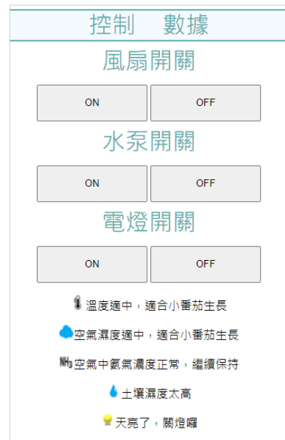
網頁上的控制開關