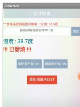
手機 app 畫面